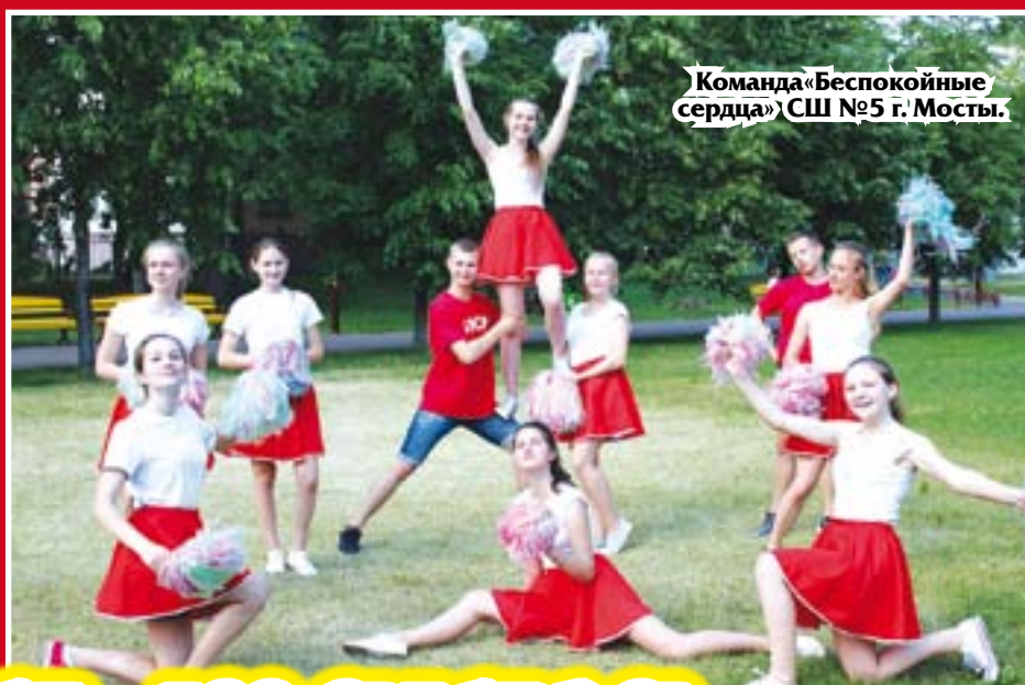
Команда «Беспокойные сердца» СШ №5 г. Мосты.

18 июня лучшие танцевальные коллективы, диджеи, представители творческих молодежных объединений и субкультур собрались на областном отборочном туре танцевального фестиваля «Огонь танца-2016» и музыкальном конкурсе «Битва диджеев «Беларусь и Я».