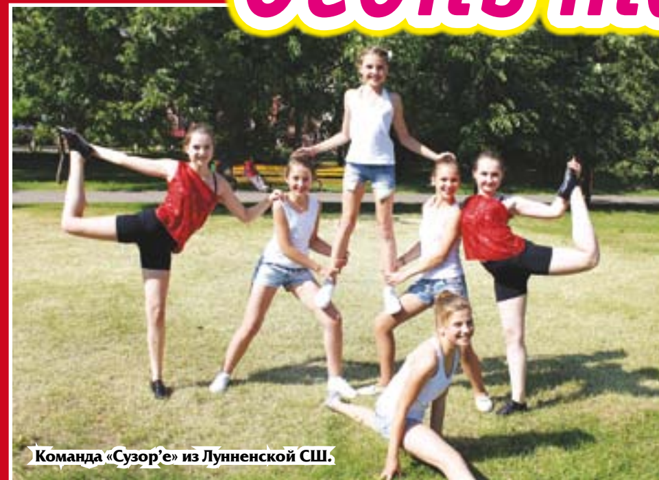
Команда «Сузор'е» из Лунненской СШ.