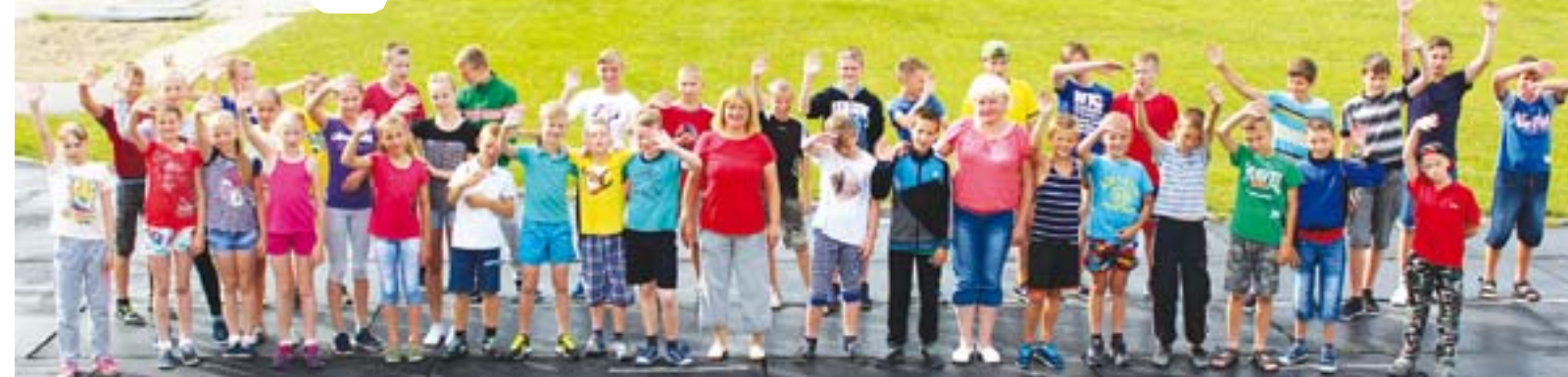
Все родители хотят, чтобы их ребенок хорошо отдохнул и набрался сил перед новым учебным годом. Для поддержания здоровья и полноценного отдыха организован летний спортивный лагерь при Мостовской районной СДЮШОР.