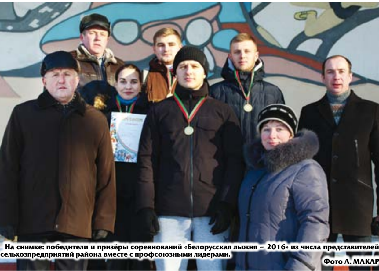
На снимке: победители и призёры соревнований «Белорусская лыжня – 2016» из числа представителей сельхозпредприятий района вместе с профсоюзными лидерами.