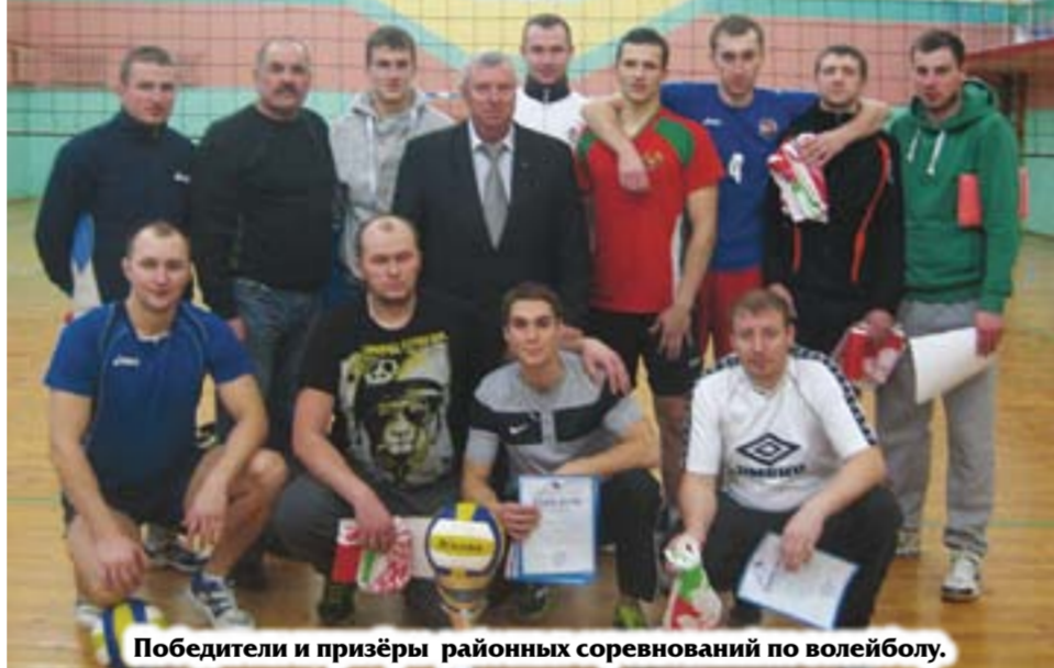
Победители и призёры районных соревнований по волейболу.

12 декабря в спортивном комплексе «Неман» 6 команд боролись за Кубок района по волейболу, утверждённый отделом образования, спорта и туризма Мостовского райисполкома. Данные соревнования были приурочены к 80-летию белорусского физкультурно-спортивного общества профсоюзов.