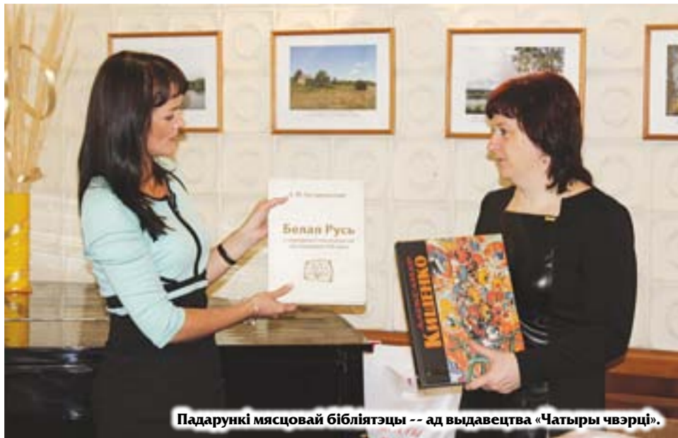
Падарункі мясцовай бібліятэцы -- ад выдавецтва "Чатыры чвэрці".