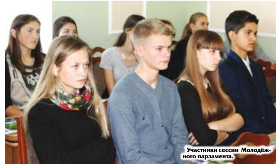
Участники сессии Молодежного парламента.