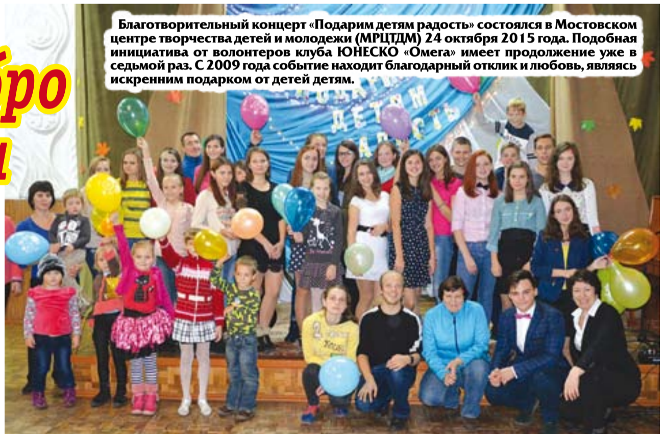
Благотворительный концерт «Подарим детям радость» состоялся в Мостовском центре творчества детей и молодежи (МРЦТДМ) 24 октября 2015 года. Подобная инициатива от волонтеров клуба ЮНЕСКО «Омега» имеет продолжение уже в седьмой раз. С 2009 года событие находит благодарный отклик и любовь, являясь искренним подарком от детей детям.

Прежде чем артисты развернулись во всю свою исполнительскую удаль, гостям показали видеопроjekt клуба ЮНЕСКО «Омега» под названием «Мы хотим вырасти счастливыми». Он о ребятах из приюта, которым