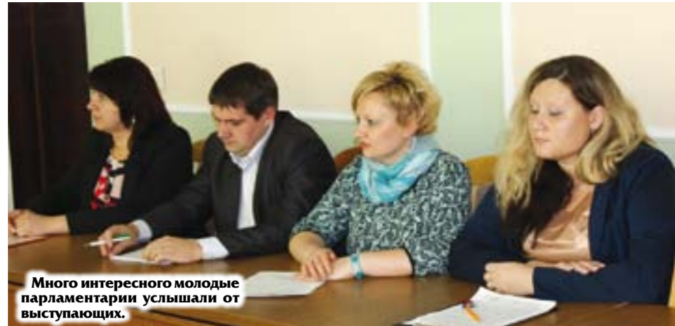
Много интересного молодые парламентарии услышали от выступающих.

Было отмечено, что в этом году в Мостовский район прибыли на работу 157 молодых специалистов. Возможно, в скором будущем некоторые из них войдут в перспективный кадровый резерв райисполкома, где сейчас состоят 11 человек в возрасте до 31 года. Два молодых, инициативных и ответственных работника, проявивших свои организаторские способности и профессиональную компетентность, включены в резерв кадров Гродненского облисполкома. Тему укрепления мо-