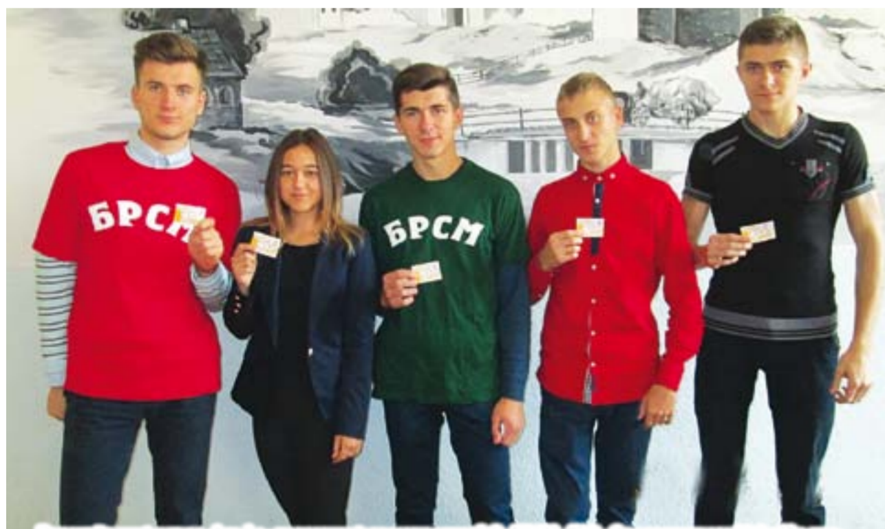
Волонтерский отряд «Альфа» первичной организации ОО «БРСМ» ГУО «Средняя школа №2 г.Мосты».

Мы остаёмся детьми, пока живы наши мамы. Родные, любимые, нежные. Ради нас они не спали ночами, прощали всё на свете, улыбались, оберегали и были рядом. И теперь наш черёд заботиться, думать, навещать и звонить. Хотя бы по праздникам и обязательно в День матери, который отмечается ежегодно 14 октября.