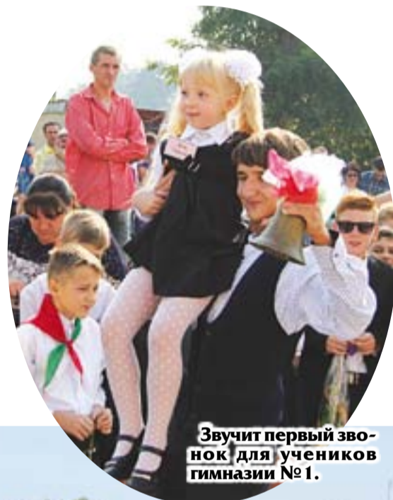
Звучит первый звонок для учеников гимназии №1.

Первое сентября -- День знаний. Это всеобщий праздник, потому что все мы когда-то учились в школе, кто-то сегодня отправляет в школу своих детей или внуков, а кто-то учит наших ребятшек уму-разуму. Для всех нас это повод вернуться мысленно в свои школьные годы, вспомнить учителей, друзей детства.