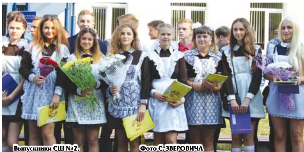
Выпускники СШ №2.