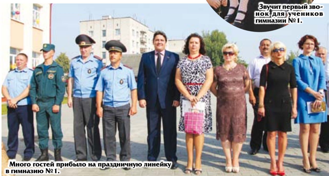
Много гостей пришло на праздничную линейку в гимназию №1.

По предварительным данным, около 3300 мальчиков и девочек в нашем районе сели первое сентября за парты. Для 311 ребятшек школьный звонок на урок вчера прозвенел впервые. 80 мальчиков и девочек впервые сели за парты в СШ №5 г. Мосты, в этой школе самый большой отряд первоклассников. А среди сельских школ больше всего первоклассников в Лунненской и Правомостовской СШ -- по 13 человек. А для 241 юноши и девушки района этот учебный год последний. И на первый взгляд сложно определить, кто из них волнуется больше: малыши, которым еще предстоит сложный, но увлекательный путь по стране Знаний, или те, кто уже стоит на пороге взрослой жизни.