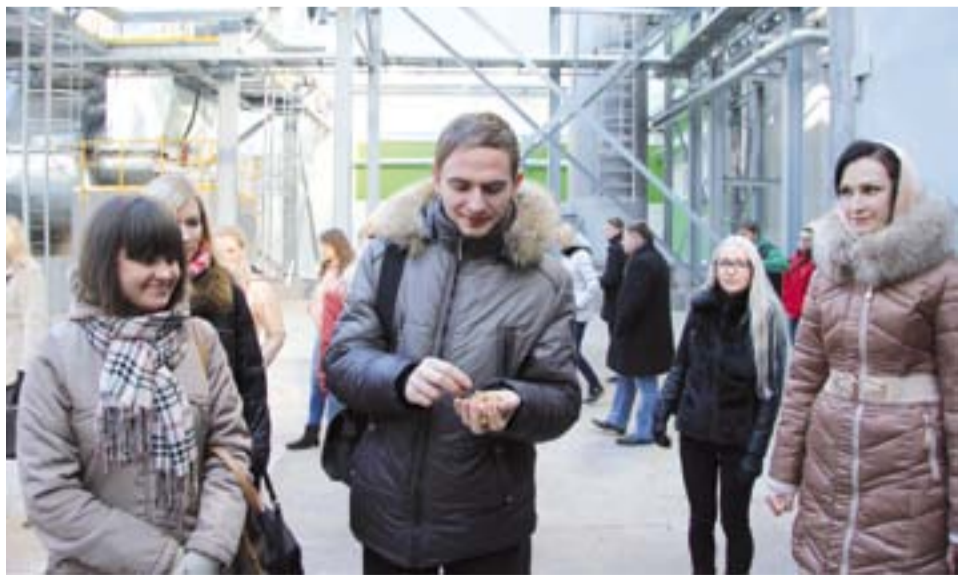
Вот оно какое, древесное волокно - сырьё для производства плит МДФ.