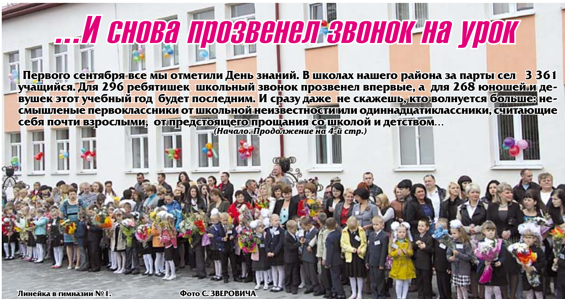
Линейка в гимназии №1.