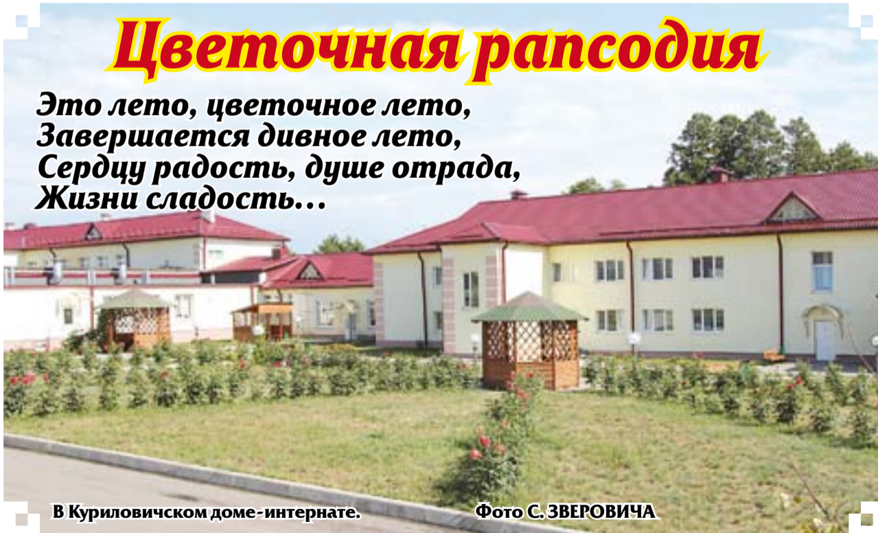
В Куриловичском доме-интернате.