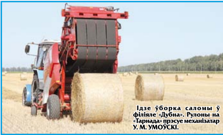
Ідзе ўборка саломы ў філіяле «Дубна». Рулоны на «Тарнада» прэсуе механізатар У. М. УМОЎСКІ.

Нараніцу 15 жніўня на Мастоўшчыне было абмалочана 15 683 гектары зерневых і зернебабовых, ці 98 працэнтаў. Ураджайнасць трымаецца на ўзроўні 59,1 цэнтнера з гектара.