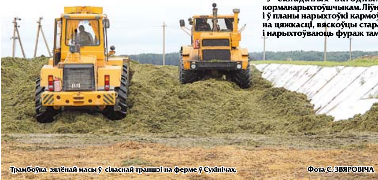
Трамбоўка зялёнай масы ў сіласнай траншэі на ферме ў Сухінічах.