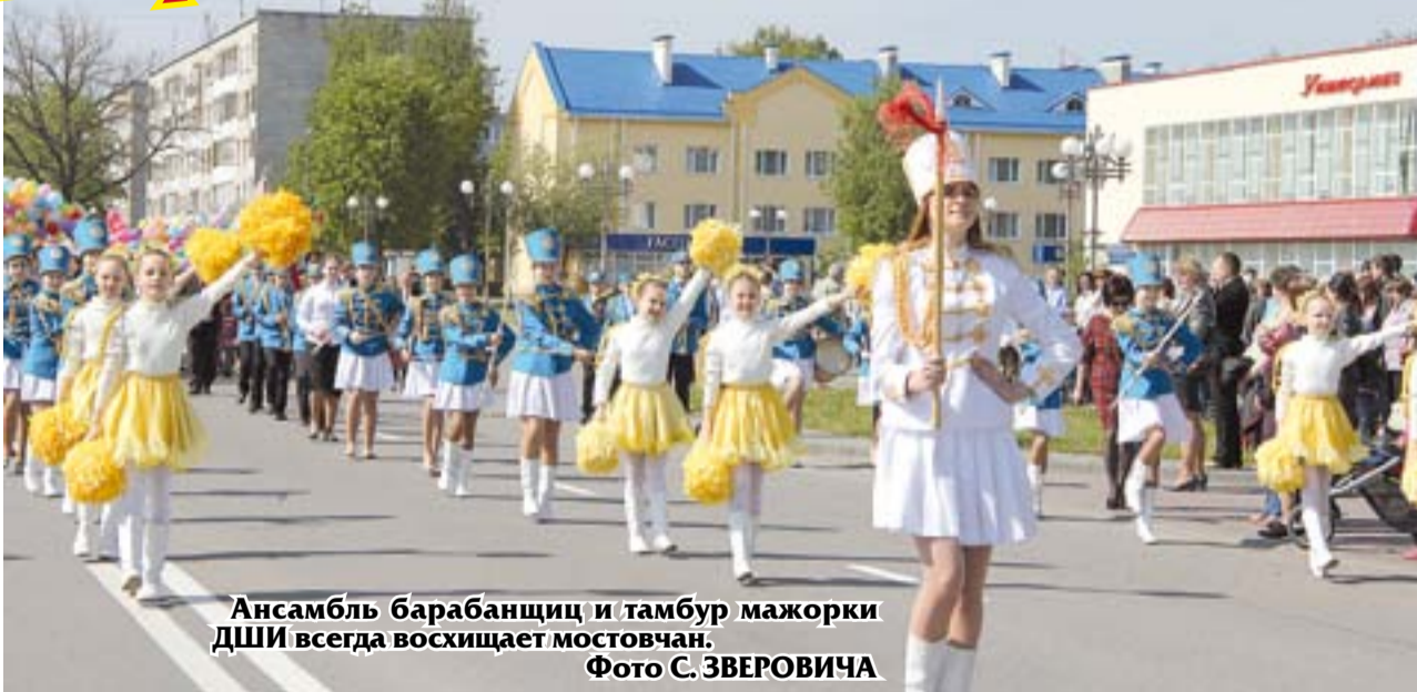
Ансамбль барабанщиц и тамбур мажорки ДШИ всегда восхищает мостовчан.