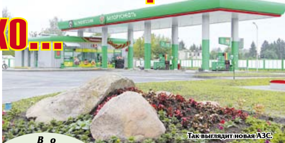
Так выглядит новая АЗС.

Во вторник в городе Мосты в направлении Щучина рядом с Мостовской сельхозтехникой была открыта новая современная автозаправочная станция республиканского унитарного предприятия «Белоруснефть-Гродноблнефтепродукт».