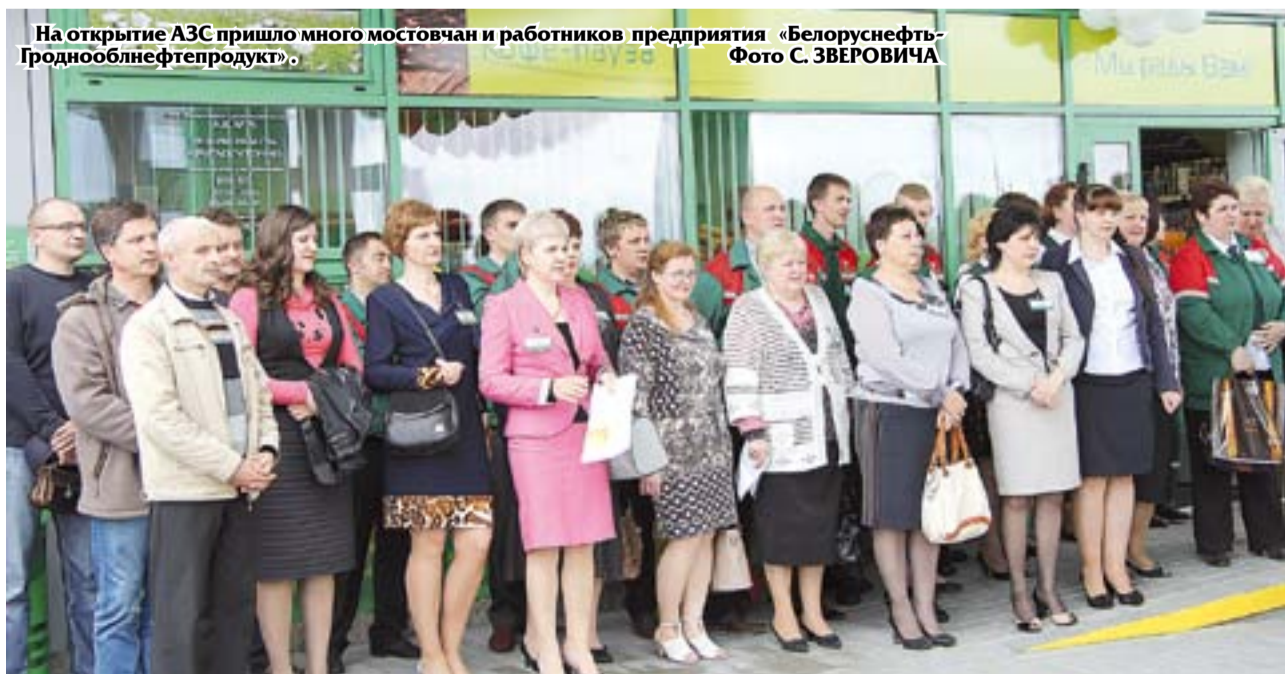
На открытие АЗС пришло много мостовчан и работников предприятия «Белоруснефть-Гродноблнефтепродукт».