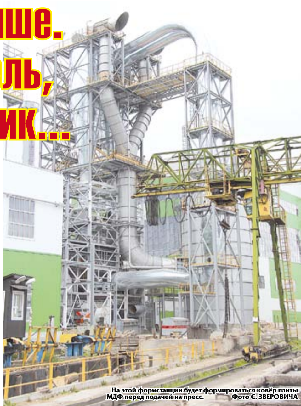
На этой формстанции будет формироваться ковёр плиты МДФ перед подачей на пресс.