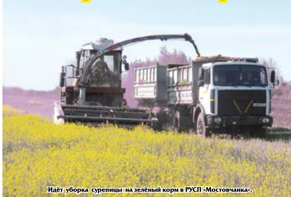
Идёт уборка сурепицы на зелёный корм в РУСП «Мостовчанка».

Сельхозпредприятия нашего района завершили сев зерновых культур (без гречихи и проса). Первыми справились с этой работой ЗАО «Гудевичи» и СПК имени А. Мицкевича. Продолжается сев кукурузы, завершается посадка картофеля, подкормка посевов.